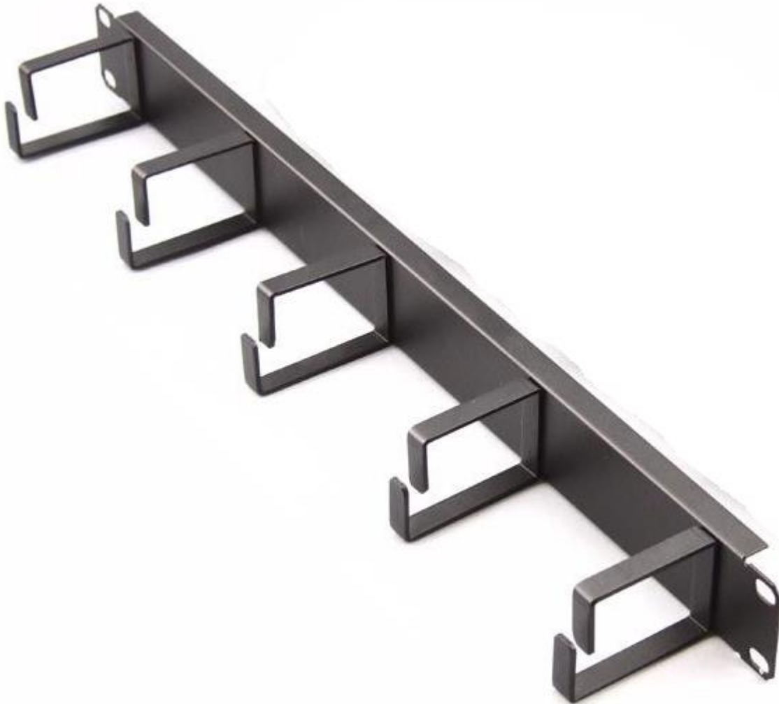
Rysunek 5. Organizer kabli

„Dostosowanie dwóch sal do prowadzenia zajęć zdalnych (okablowanie, montaż sprzętu, elektryka)” w Budynku Głównym Akademii Morskiej w Szczecinie, ul. Wały Chrobrego 1-2