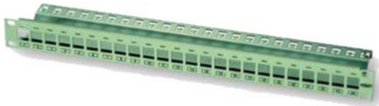
Rysunek 4. Panel krosowy 24 port modułowy ekranowany

Panele należy opisać numerami porządkowymi z lewej strony.