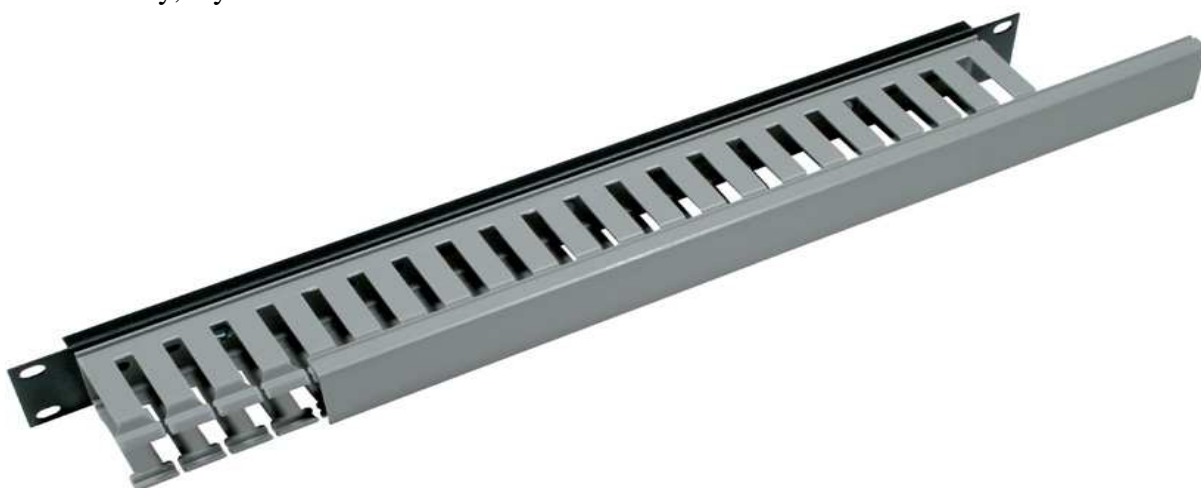
Rysunek 5. Organizator kabli

Listwa organizera kabli dla 19" szaf ze zdejmowaną osłoną przednią i możliwością wypuszczenia nadmiaru kabla do wnętrza szafy. Kolor czarny, wysokość 1U.