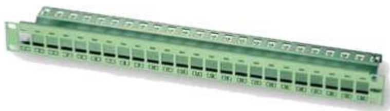
Rysunek 4. Panel krosowy 24 port modularny ekranowany

Panele należy opisać numerami porządkowymi z lewej strony.