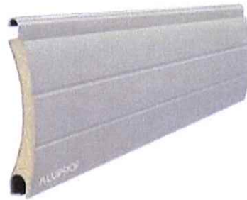
PA 39 - profil aluminiowy wypełniony pianką poliuretanową